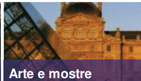
Arte e mostre