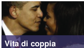
Vita di coppia